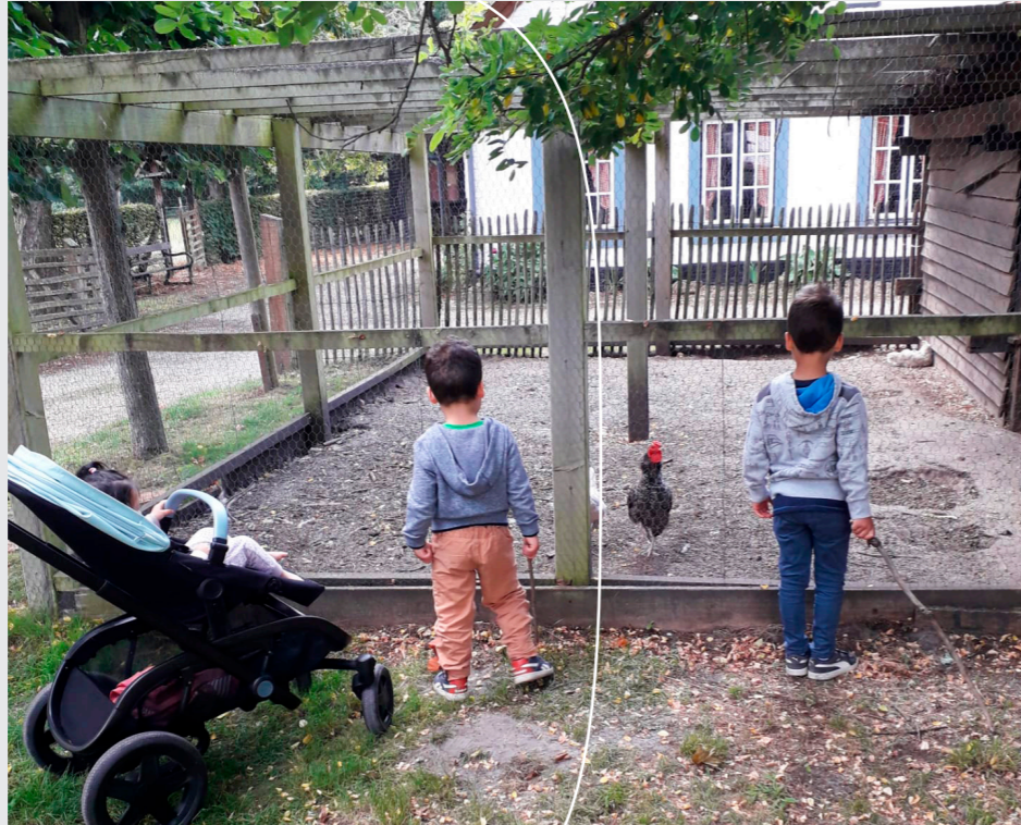
De kinderen van project Simbahuizen genieten van een welverdiende vakantie in een vakantiepark.

Met dank aan Ackermans & van Haaren, Allianz, BASF, Bricks and Leisure, ENGIE Electrabel, Goodman, Patroba, Fonds Louis Bourdon, het Fonds voor Solidaire Zorg van de Koning Boudewijnstichting en allen die ons steunden.