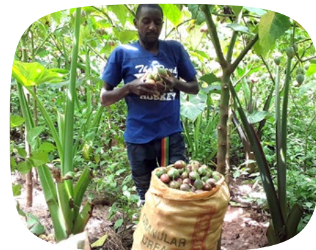
Deze deelnemer van het programma Sanô lanceerde zijn eigen landbouwbedrijfje.

Moeder van vier kinderen en deelneemster aan het vorige familieverstevkende programma “Sanô”