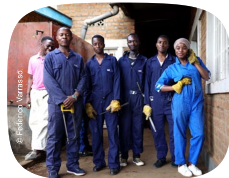
Meerdere jongeren in DR Congo volgen een opleiding tot lasser via onze partner Don Bosco.