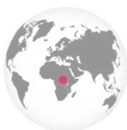
DR Congo en Burundi

Alle ouders willen hun kind een goede omgeving bieden om in op te groeien. Maar soms botsen families op obstakels die ze moeilijk alleen kunnen trotseren. Veel families in DR Congo en Burundi kunnen hun kinderen niet de zorg bieden die ze nodig hebben om uit te groeien tot sterke volwassenen. In dit dossier ontdek je hoe we met ons nieuwe vijfjarige project de families van 6 300 kinderen in Burundi en DR Congo helpen versterken.