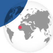
Senegal en Mali

1.500 talibés, bedelkinderen in Senegal en Mali, krijgen eindelijk toekomstperspectieven dankzij een sociaal ondersteuningsnetwerk