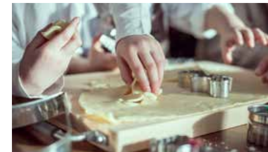
Onze begeleiders en Simba-ouders vullen de extra uren met de kids creatief in.

de afgelopen weken ondersteunde om dit rond te krijgen. En ook aan onze overheden voor hun krachtvolle reactie. Met al die steun kunnen wij ervoor zorgen dat de kern van ons werk ten allen tijde bewaard blijft: dat kinderen kunnen opgroeien in een veilige omgeving, met de liefde en zorg van stabiele volwassenen.