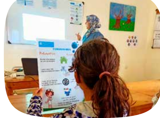
Een sensibiliseringsessie in één van onze sociale centra in Marokko.

Italië, Oostenrijk, El Salvador, Boznië-Herzegovina, China, Ethiopië, overal ter wereld zetten onze lokale teams extra steunprojecten op voor kinderen en families in moeilijkheden. Hiernaast zetten we alvast een aantal initiatieven op een rijtje.