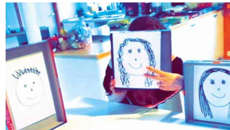
Met een fotodagboek geven de jongeren elke dag uitdrukking aan hun emoties en humeur.