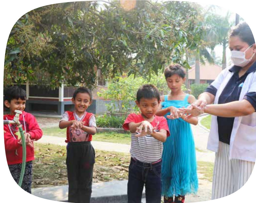
Kinderen uit één van onze kinderdorpen in Nepal leren hun handen wassen.