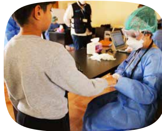
Een medische check-up voor de kinderen in onze kinderdorpen in Syrië.