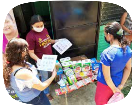
Een SOS medewerker in El Salvador deelt voeding en hygiënekits uit aan één van de 1300 families die we er ondersteunen.

Alle 136 landen waar SOS Kinderdorpen actief is, hebben zich gemobiliseerd om samen de mogelijke gevolgen van deze pandemie voor de meest kwetsbare kinderen en hun families te verzachten. Door samen te werken met medische partners, zodat medische zorg ook tot bij deze kinderen geraakt. Door in te zetten op het mee ter beschikking stellen van beschermingsmateriaal voor onze ploegen op het terrein, zodat ze er kunnen blijven zijn voor de meest kwetsbaren. En door er mee voor te zorgen dat de toevoer van zuiver water en voldoende voedsel gevrijwaard blijft als de familie hier tijdelijk niet meer voor kan zorgen.